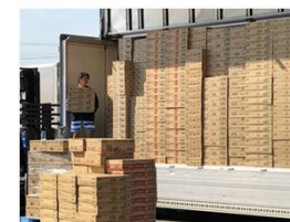
バラ積み・バラ降ろしによる非効率な荷役作業