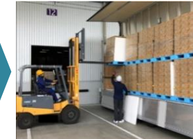
パレットの利用による荷役時間の短縮