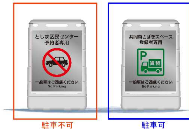
図-2 共同荷さばきスペース看板 (例)