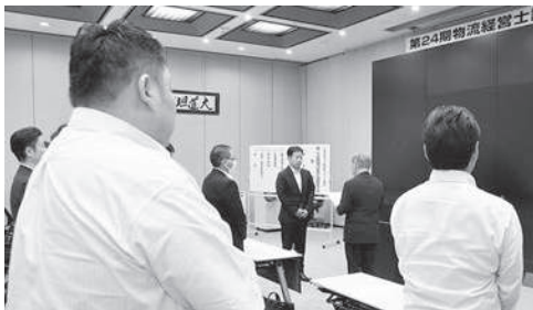
交流深め31人が修了

時間午後1時30分～4時30分、会場は東ト協会館7階大会議室。受講対象は会員事業者