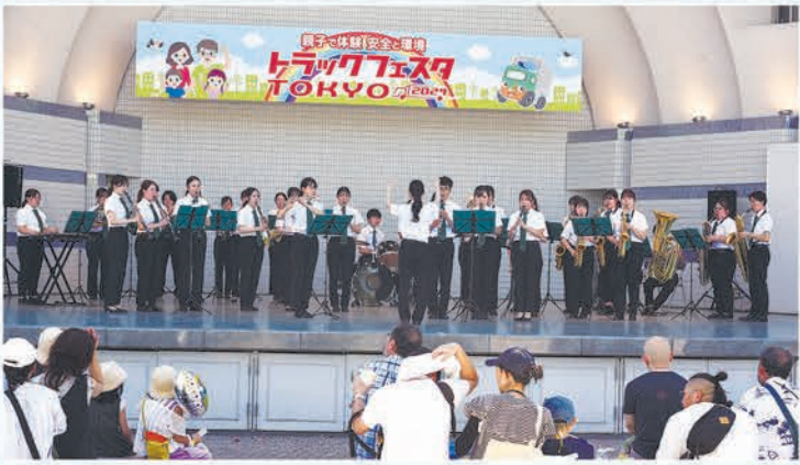
東京農業大学全学応援団吹奏楽部の演奏