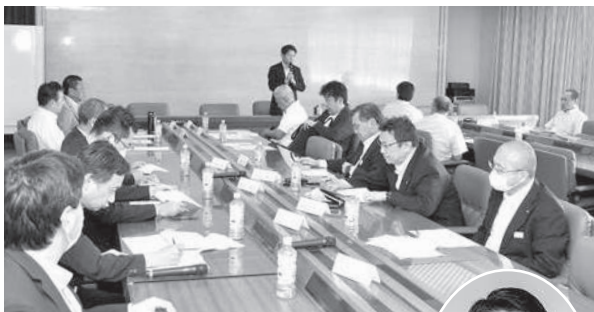
東ト協 経営教育委員会