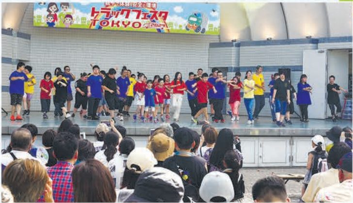
キッズダンスチーム・スリーセブンのパフォーマンス