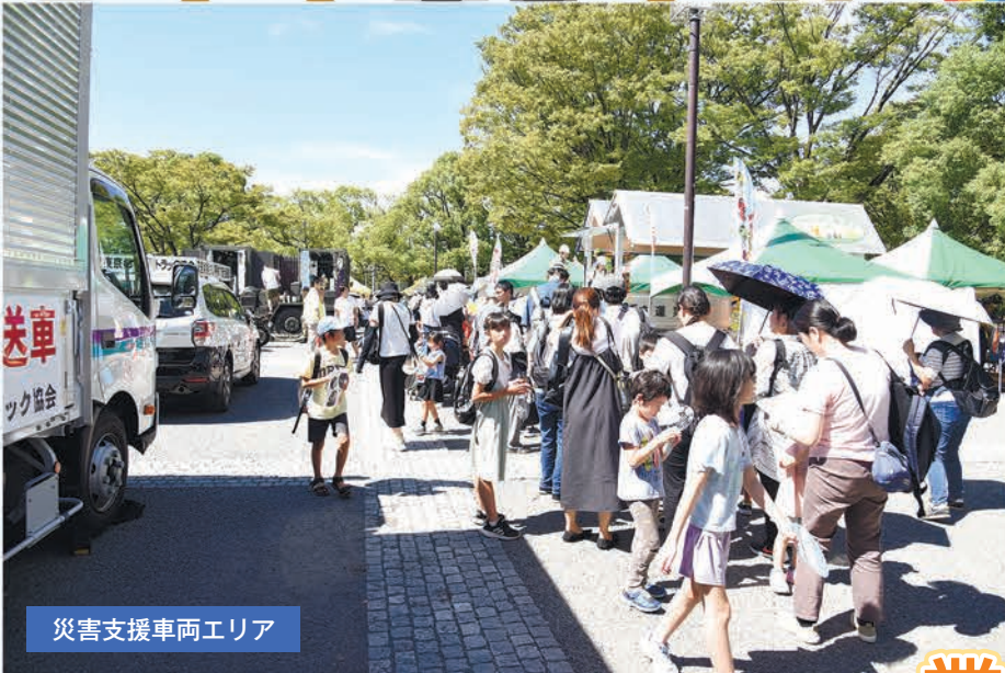
災害支援車両エリア