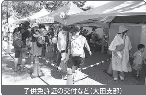
子供免許証の交付など(大田支部)