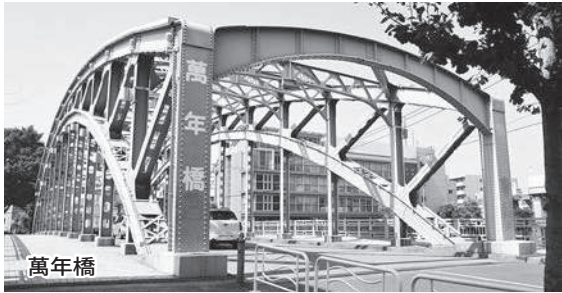
小名木川が隅田川に合流するところにある。「今の万年橋は元番所の橋とあり」とある(『武江年表』1680(延宝8)年)。この近くに小名木川を通る船の荷を改める「川船番所」があったが移設された。この付近から、隅田川が一番美しいといわれる清洲橋の眺望を愛でる人が多いという。

8月末から9月にかけて、自転車かジョギング並みの速さで迷走しながら日本列島をゆくりと縦断していった台風10号。各地に豪雨・大雨の被害を与え、河川付近では水かさが増して氾濫するのではないかと、流域の人たちをよきもきさせ