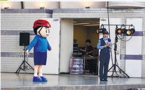
警視庁交通部の交通安全教室