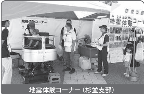
地震体験コーナー(杉並支部)