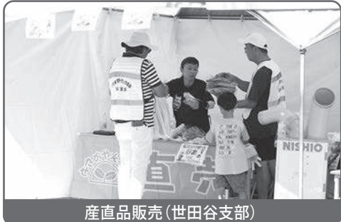
産直品販売(世田谷支部)