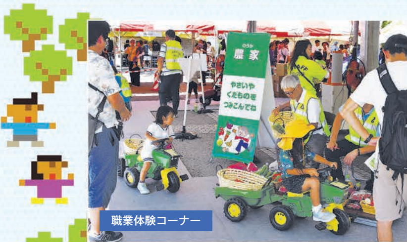
職業体験コーナー