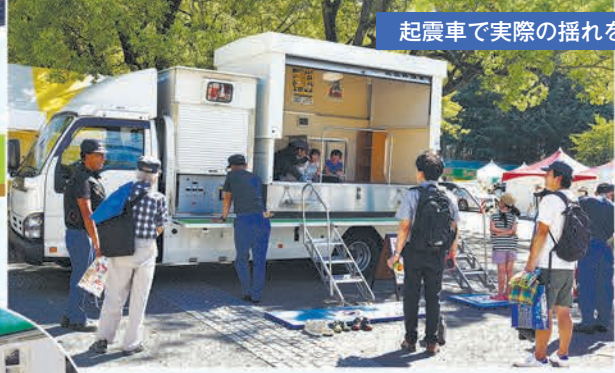
起震車で実際の揺れを体験