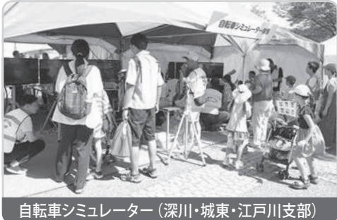
自転車シミュレーター(深川・城東・江戸川支部)