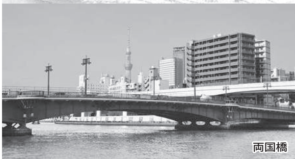
初めは「大橋」と名付けられていたが、1693(元禄6)年に新大橋の架橋で両国橋に改められた。明暦の大火で広小路と呼ばれる火除け地が設けられ、見世物小屋・水茶屋など江戸有数の盛り場となった。