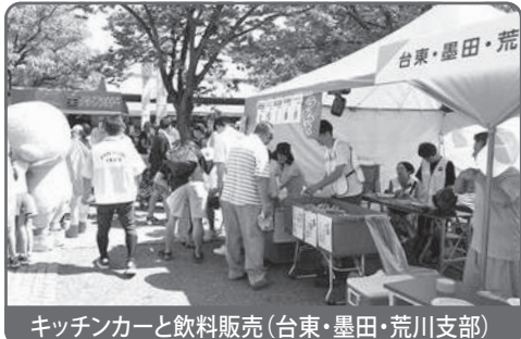
キッチンカーと飲料販売(台東・墨田・荒川支部)