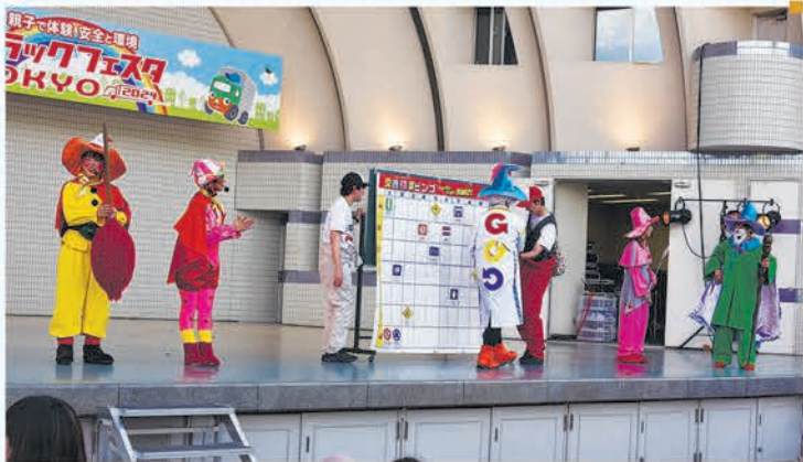
フェスタオリジナルキャラクターによる交通安全ビンゴ大会