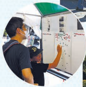
災害発生時に出動する東ト協の輸送隊の車両を展示したほか、東ト協ブースでは、災害復興をテーマとしたパネルや新聞広告を展示。