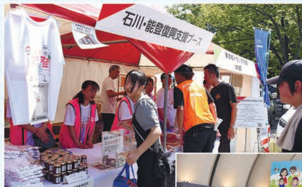
石川・能登復興支援ブースでの特産品販売や募金活動。