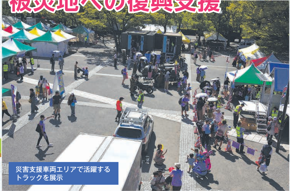
災害支援車両エリアで活躍するトラックを展示