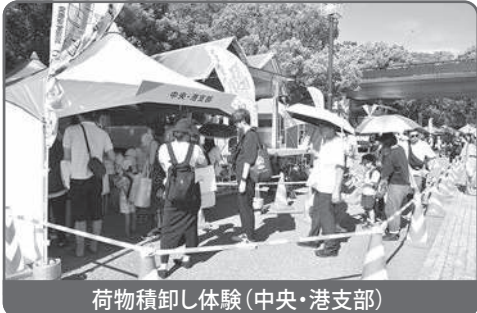
荷物積卸し体験(中央・港支部)