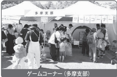
ゲームコーナー(多摩支部)