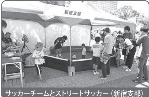
サッカーチームとストリートサッカー(新宿支部)