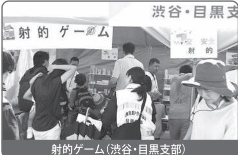
射的ゲーム(渋谷・目黒支部)