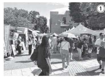
① 業界全体でフェスタを盛り上げた。