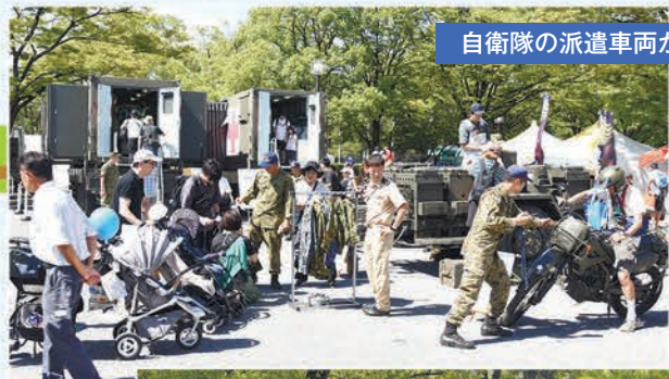
自衛隊の派遣車両が出動